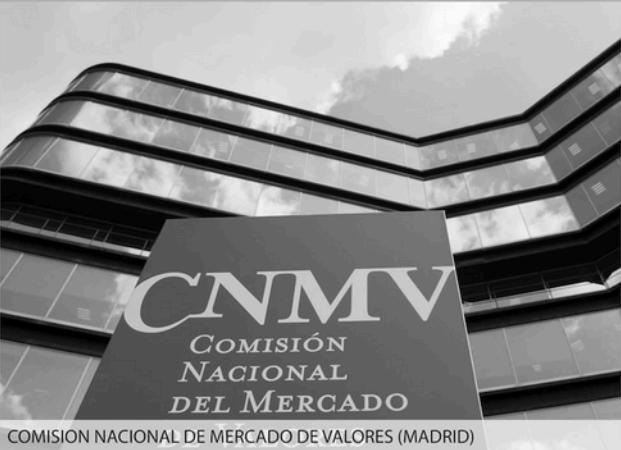
COMISIÓN NACIONAL DE MERCADO DE VALORES (MADRID)