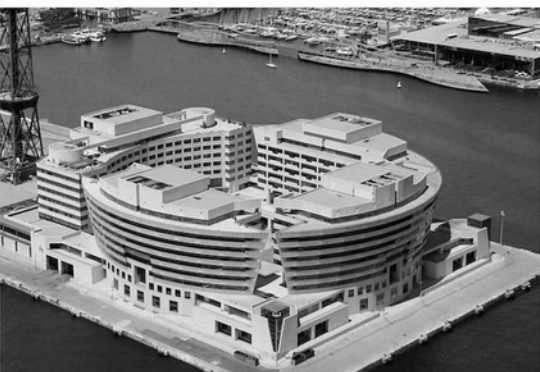
WORLD TRADE CENTER (BARCELONA)