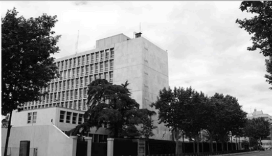
EMBAJADA DE LOS ESTADOS UNIDOS (MADRID)