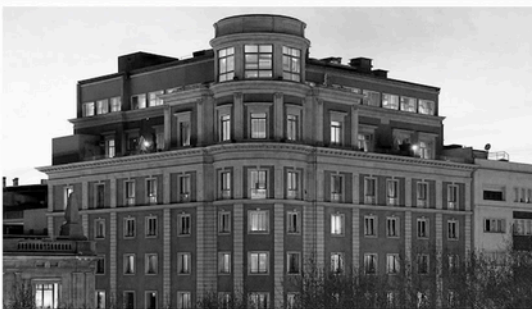
HOTEL MANILA (BARCELONA)