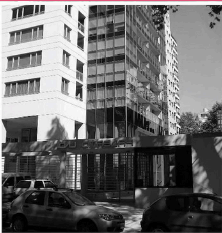
TORRE PALERMO 1 (BUENOS AIRES)