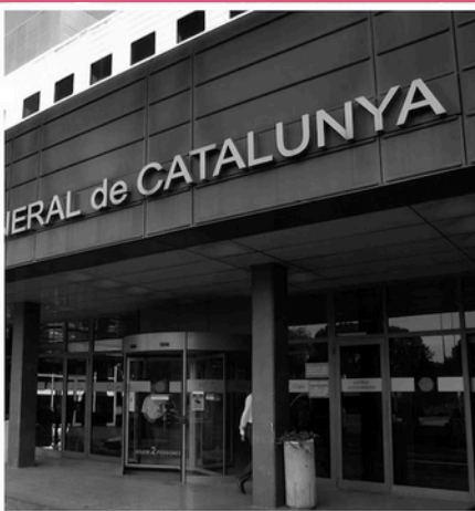
HOSPITAL GENERAL DE CATALUNYA (BARCELONA)