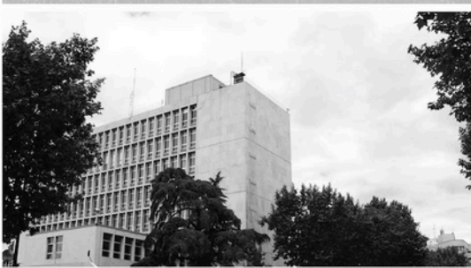
FUNDACIÓN CARLOS MARTÍN (MADRID)