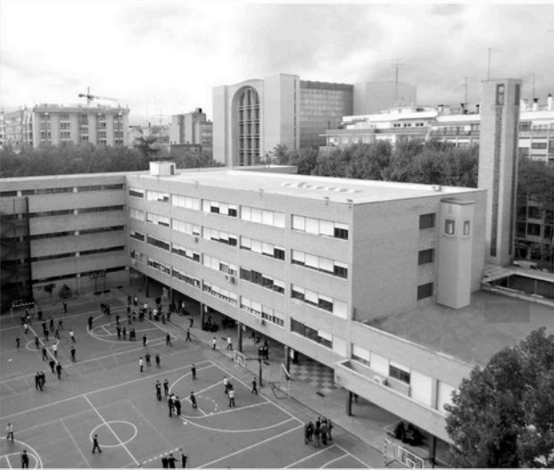
RESIDENCIA SIERVA DE SAN JOSÉ (SANTIAGO DE CHILE)