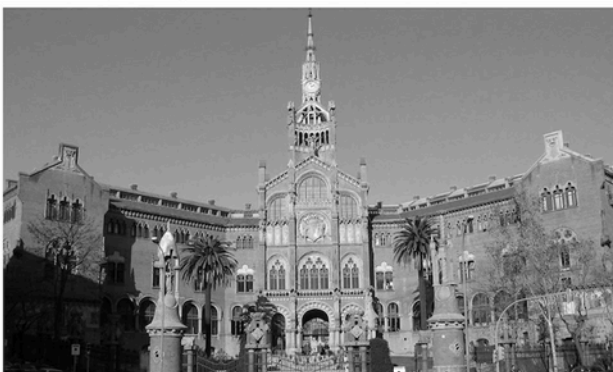
HOSPITAL SANT PAU (BARCELONA)