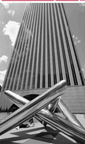
TORRE PICASSO (MADRID)